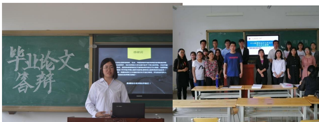
2014级国际经济与贸易本科专业毕业论文答辩现场

实践教学方面，经贸学院本学期按照教务处的要求开展了2018届毕业生毕业论文的工作。成立了毕业论文工作小组，拟定了毕业论文工作计划。特别是针对第一届本科毕业生2014级国际经济与贸易专业的毕业论文工作做了细致的工作计划和准备。并在规定的时间内，依据程序对毕业生进行了论文答辩工作，答辩小组经过集中讨论和专家审核推选出了优秀本科毕业生论文。